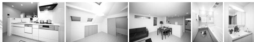
※掲載の外観・室内写真は今回販売現地を撮影したものです。